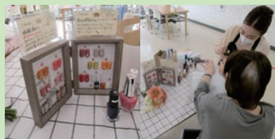
ネイルボランティア