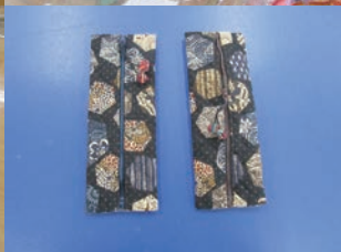
手作り作品クラブ