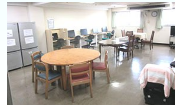
多目的室 麻雀、パソコンなどがあります