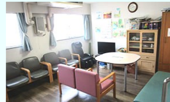
200号室 みんなでくつろげる空間です