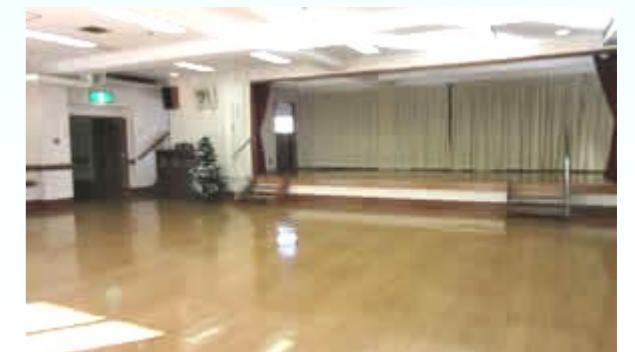
3Fホール カラオケやイベントを行います