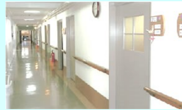
廊下 あかるくきれいな環境です