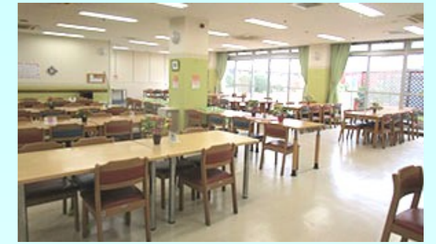
食堂 広々とした明るい空間です