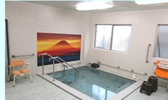
浴室 ゆっくりのんびり入れます