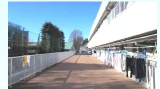
2Fテラス 南向きで風通しもいいです