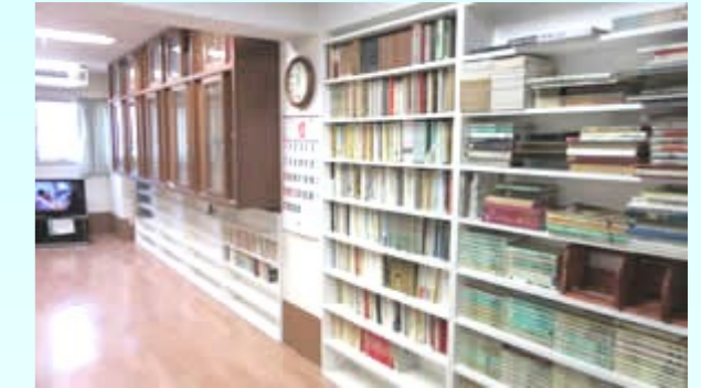
図書室 貸し借り自由です